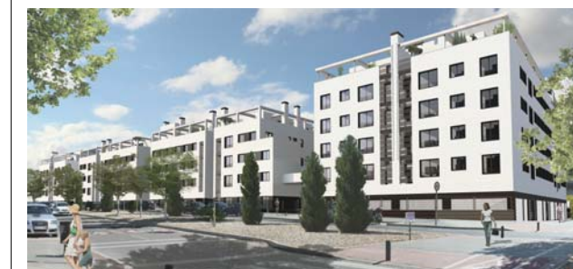
VISTA DESDE LA CALLE JORGE OTEIZA ESQUINA PASEO DE LA DEMOCRACIA