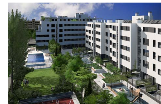
VISTA DEL INTERIOR DE LA URBANIZACIÓN