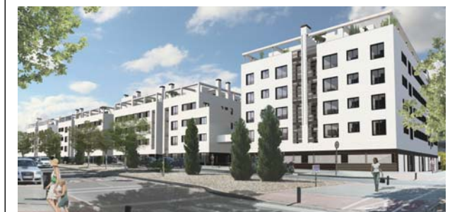
VISTA DESDE LA CALLE JORGE OTEIZA ESQUINA PASEO DE LA DEMOCRACIA