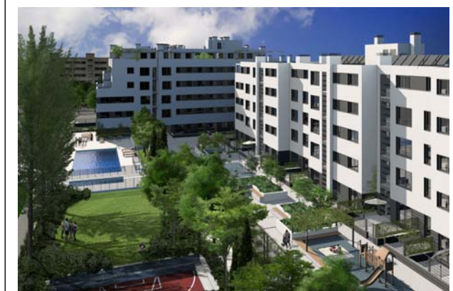
VISTA DEL INTERIOR DE LA URBANIZACIÓN